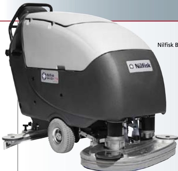
Nilfisk BA 851

Sono solo alcune delle caratteristiche della serie di lavasciuga pavimenti Nilfisk BA651/751/851 che la rendono unica nel suo genere, e che garantiscono un reale valore aggiunto a chi svolge l'attività di pulizia. La serie di lavasciuga pavimenti Nilfisk BA651/751/851 rappresenta una combinazione unica tra un moderno design ergonomico, elevate prestazioni e un'eccellente trazione. Una linea di lavasciuga pavimenti operatore a terra disegnata per la pulizia di ampie aree.