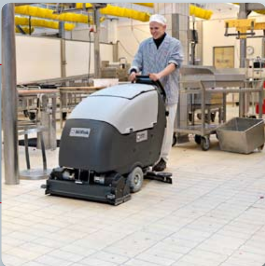
Nilfisk BA 751C