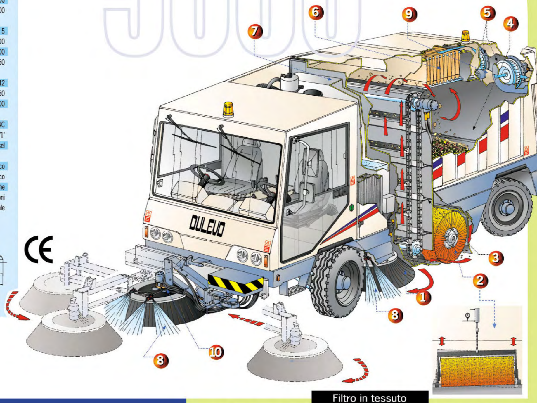
Filtro in tessuto

La spazzola anteriore brandeggiante (10) consente l'efficace pulizia dei marciapiedi e di altre zone difficilmente raggiungibili con le spazzole laterali. Il brandeggio di 180°, sul lato destro e sinistro, è azionato tramite un comodo joy-stick posto sulla portiera in cabina, in una posizione che evita all'operatore di distrarsi dalla guida. La spazzola anteriore è regolabile idraulicamente in tutte le sue funzioni, sia di posizionamento, che di inclinazione laterale e longitudinale. In caso di urti, affidabili sensori magnetici azionano il rientro rapido della spazzola, che è comunque anche protetta da una ulteriore sicurezza meccanica.